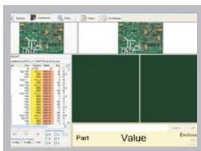
Einstellung ULP-Programm Eagle